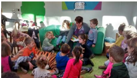
De kleuters van 't Startnest op bezoek bij Peuteropvang 't Overstapje.

Peuteropvang Zijdelwaard werken onderling samen en samen met BSO De Scheg, aan de overkant van de weg en kdv. Alle opvangsoorten in de wijk Zijdelwaard horen bij elkaar, vormen een cluster en werken samen met het Startnest en de Vuurvogel. Samen met IKC het Duet, KC Legmeer en KC Meerwijk zitten we in cluster Uithoorn van kinderopvang Solidoe.